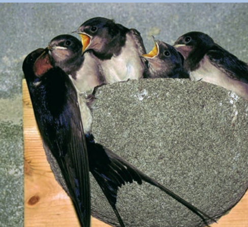
Eine Rauchschnalben-Familie in ihrem Kunstnest.

Nestgrundlage können Sie Brettchen anbringen, die mit Kaninchen- draht überzogen sind. Manchmal genügt auch schon ein 10 bis 15 cm breiter, weiß gestrichener Rauputzstreifen unter dem Dachvorsprung.