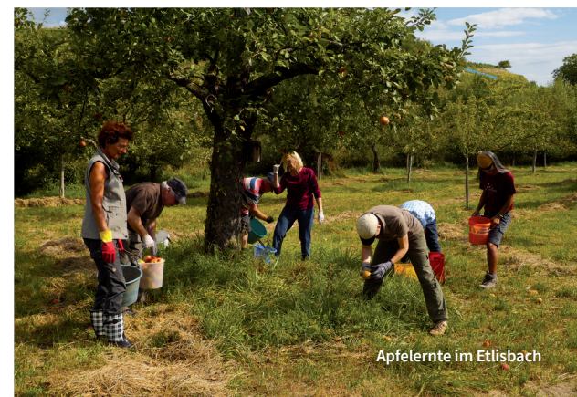
Apfelernte im Etlisbach

Zeitpunkt wird kurzfristig bekannt gegeben.