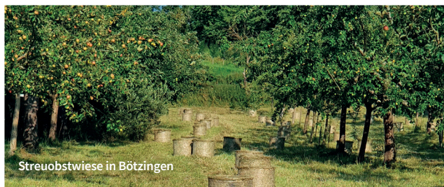
Streuobstwiese in Bötzingen